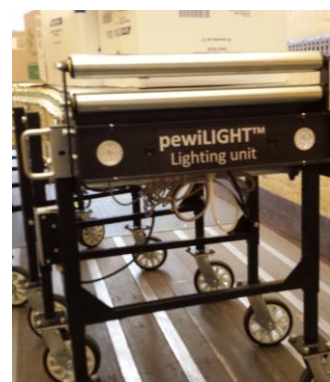
pewiLIGHT™, Beleuchtungseinheit mit doppelter LED-Beleuchtung auch zu gebrauchen für unsere pewiGRAFLEX™