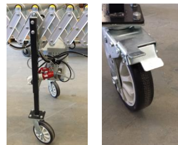
Robuste Räder mit und ohne Bremse