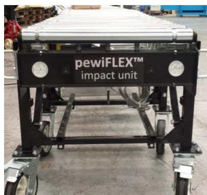
pewiFLEX™, impact unit, Schlagzähe Einheit